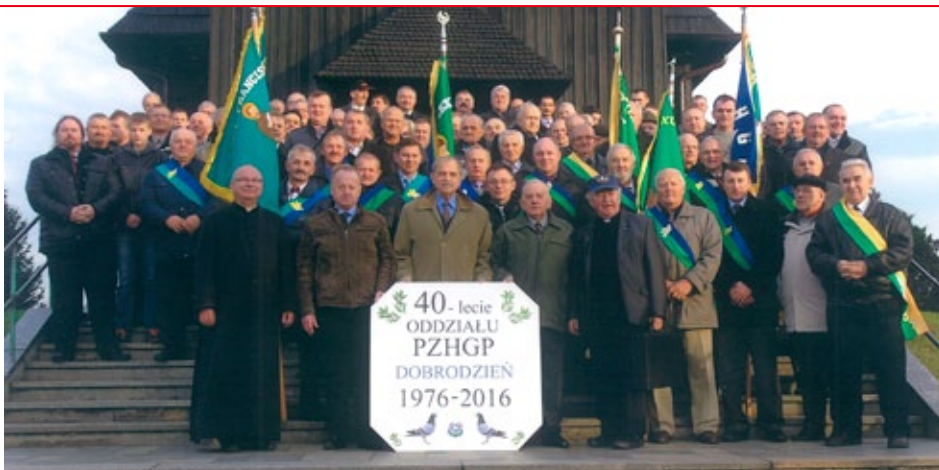
Uczestnicy Jubileuszu 40-lecia Polskiego Związku Hodowców Gołębi Pocztych, Oddział Dobrodzień