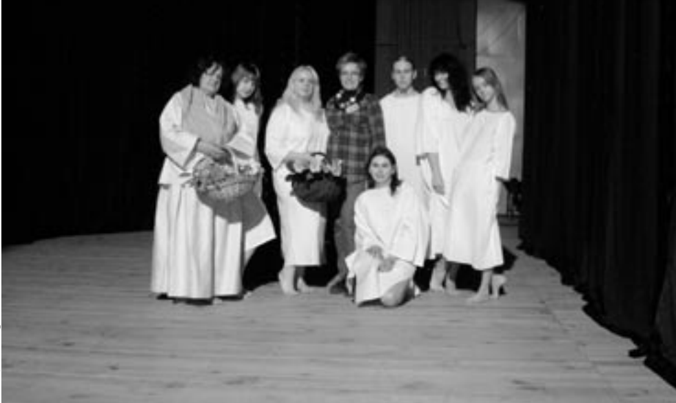
Aktorzy teatru po występie w Nysie na „Proscenium”.

dzieci. Na początku bowiem stworzyliśmy dwa krótkie spektakle lalkarskie. Dzieci jednak włożyły bardzo dużo pracy w przygotowanie przedstawienia ponieważ samodzielnie wykonały lalki – kukielki z drewnianych łyżek kuchennych oraz namalowały własną dekorację. Chłopcy przedstawili historyjkę pt. „Pociąg”, a dziewczynki „Kłopoty łyżki”. Przedstawienie teatru lalkowego obejrzeli